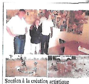
Soutien à la création artistique