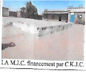
LA M.J.C. financement par C.K.J.C.

Dans le dispensaire l'examen se fait sur des tables de bureau et les bureaux sont des tables d'examen