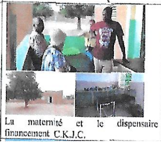
La maternité et le dispensaire financement C.K.J.C.