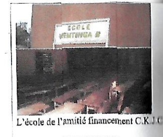
L'école de l'amitié financement C.K.J.C.