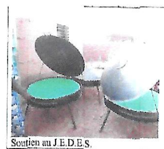
Soutien au J.E.D.E.S.