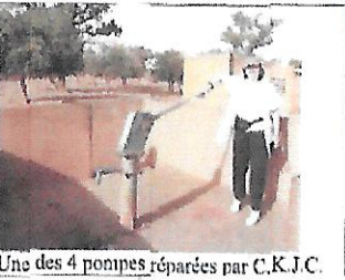
Une des 4 pompes réparées par C.K.J.C.