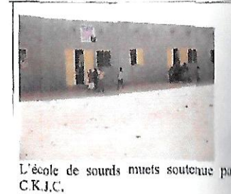
L'école de sourds muets soutenue par C.K.J.C.