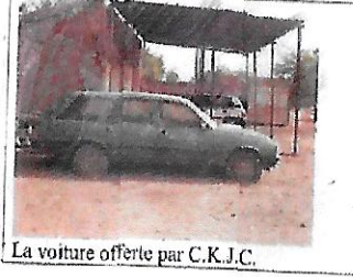
La voiture offerte par C.K.J.C.