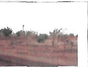
Le plateau sportif financement C.K.J.C.