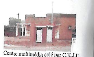
Centre multimédia créé par C.K.J.C.