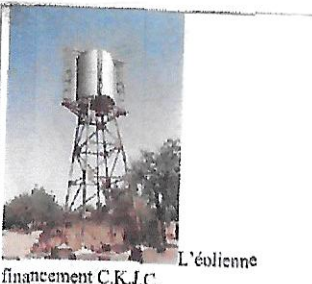
L'éolienne financement C.K.J.C.