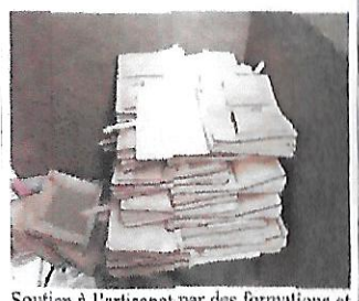
Soutien à l'artisanat par des formations et achats pour le marché de Noël

Les caniveaux : on en fait toujours, l'équivalent de une à deux rues par an.