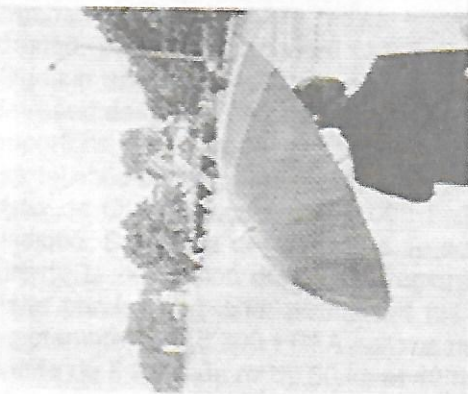
De catastrophiques inondations ont causé...

Le Burkina Faso, ancienne colonie française, vit des moments difficiles suite à de graves intempéries.